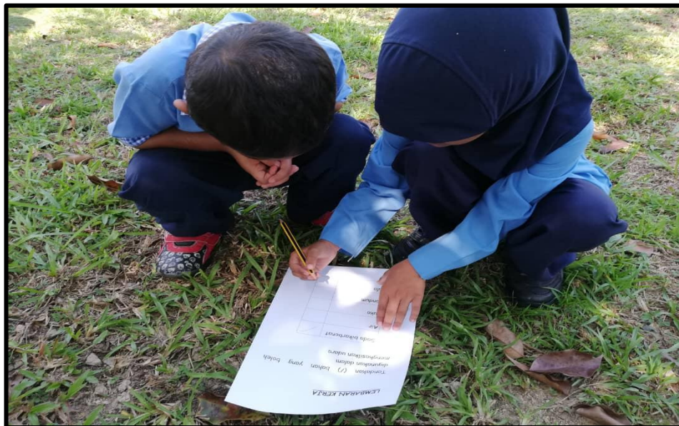
Kanak-kanak menanda pada lembaran kerja mengenai bahan yang menghasilkan tekanan udara