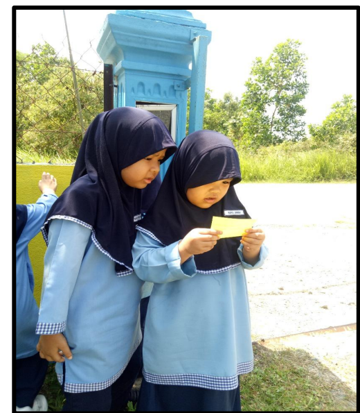
Kanak-kanak membaca tugas yang perlu dilakukan pada kertas warna